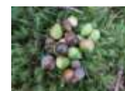
どんぐりの落下 9月～10月