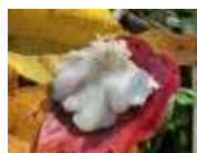
ブナハリタケ発生 10月中