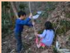
↑フジづるのブランコ