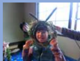
↑つるや木の実でリースづくり スノーシューや雪遊びも！！