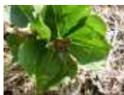
エンレイソウ開花 4月中旬～5月中旬