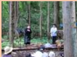
↑ポンポコばやしにて音楽会