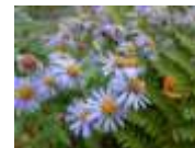
野菊の開花 9月下旬～10月

「じね～んの森」は南会津町高野区にあります。昔は里山だったところが利用されなくなってそのままにされていました。5年ほど前から、「みんなで遊べる場所にしよう」と地元のNPOを中心に手入れを続けています。「じね～んの森」という名前には、地道にこつこつ焦らずに、自然との共生をめざした森づくりを「じね～んと、やっぺ」という気持ちがこめられています。ここは、ありのままの自然を大切にしたい、ゆったりとした空間、みんなの里山です。