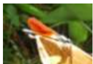
様々なトンボ類の 出現 6月中旬～