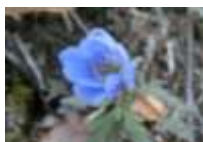
キクザキイチゲ開花 4月中旬～4月下旬