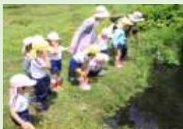
↑虫とりや生き物の観察