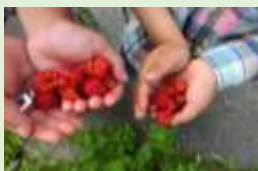
↑木の实・草の実とり