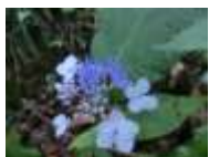
ヤマアジサイ開花 8月下旬～